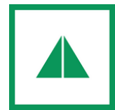
Abbildung 4 Abzeichen ans Cevi-Hemd für den Helferkurs https://ceviurdorf.ch/kluft/

Obwohl der noch junge Cevianer erst ein unwohles Gefühl hat, erlebt er eine spannende Woche mit vielen neuen Kindern und Leitern aus anderen Abteilungen. Es beginnt Beziehungen in andere Regionen zu knüpfen und allgemein eine Offenheit gegenüber Fremden zu entwickeln. Nun vergehen weitere zwei Jahre, bis sich er oder sie endlich für den Helferkurs anmelden kann und somit als Hilfsleiter anerkannt wird. Eine spannende Zeit steht bevor, in der das Kind in der Pubertät zu einem Jugendlichen heranwächst. Ab sofort gilt es nicht nur Spass zu haben unter Freunden, sondern auch eine Verantwortung für die jüngeren Kinder zu übernehmen. Diese Entwicklung ist nicht nur für das Kind, sondern auch für die nächsthöheren Leiter kein einfacher Prozess.