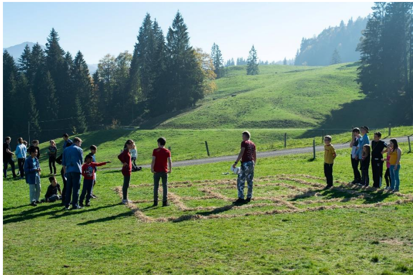
Abbildung 9 Hier ist das Herbstlager 2018 abgebildet, in dem ein Spiel erklärt wird.

Man übernimmt Aufgaben, merkt, dass man in gewissen Aufgaben seinen Freunden überlegen ist und sieht das Resultat in den glücklichen Gesichtern der Kinder widerspiegelt. Das gibt einem immer wieder Sicherheit und Halt in Phasen, in denen man selbst unsicher ist oder eine Entwicklung durchmacht.