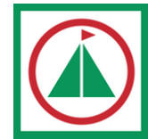
Abbildung 6 Abzeichen ans Cevi-Hemd für den GLK 2 https://ceviurdorf.ch/kluft/

Wir sind jetzt schon fast am Ende der Laufbahn angekommen. Ab jetzt gibt es noch einige Kurse, um sich fachspezifisch weiter zu bilden oder den Jugend-und-Sport-Ausweis zu erlangen. Mit dem J+S Ausweis werden einem die Türen zu anderen Jugendverbänden geöffnet. Zusätzlich kann man an diversen sportlichen Anlässen oder im Allgemeinen in praktisch jeder Arbeit mit Kindern und Jugendlichen als Leiter dabei sein. Im Cevi erhält man diesen Ausweis, indem man den GLK 3 absolviert.