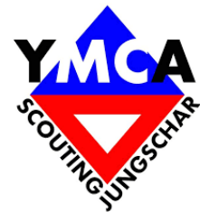
Abbildung 2 Offizielles YMCA Logo https://www.ceviregion-bern.ch/cevierinnen/vereine-gruppen/international/

Um der Idee des Vereins auf die Spur zu kommen, muss man ins Jahr 1850 zurückreisen. Gemäss Cevi Schweiz 1 sind die ersten Cevi-Vereine in England als Antwort der Erweckungsbewegung auf die im Zuge der Industrialisierung auftretenden Nöte und Probleme entstanden. In der Schweiz sind die lokalen Gruppen parallel und selbständig gewachsen. 1855 ist dann der YMCA «Young Men's Christian Association» (Deutsch: CVJM «Christlicher Verein Junger Männer») in Paris gegründet worden. Henry Dunant, der Gründer des Roten Kreuzes, ist dabei massgeblich beteiligt gewesen.