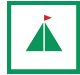
Abbildung 5 Abzeichen ans Cevi-Hemd für den GLK 1 https://ceviurdorf.ch/kluft/

Zurück zur Cevi-Laufbahn: Inzwischen hat der frisch ausgebildete Hilfsleiter in diversen jüngeren Stufen Einsätze geleistet und hat auch schon zahlreiche Einblicke in das Leitersein erhalten. Mit einem Alter von 14 Jahren möchte er jetzt auch endlich ein Gruppenleiter werden und besucht mit seinen Freunden, die er schon seit über sieben Jahren hat, den GLK 1 8 . In diesem Kurs geht es nun aber richtig los, wie in der Ausschreibung auf der Cevi-DB 9 zu lesen ist: