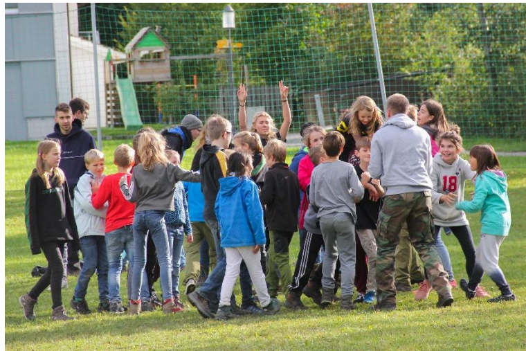
Abbildung 8 Der Cevi-Stäfa im Lager mit dem Cevi Mönchhaltdorf. Auf der Abbildung erkennt man, wie die Leiter, unter ihnen auch ich, mit aller Kraft versuchen die wilden Kinder zusammenzuhalten. https://www.flickr.com/photos/cevi-staefa/albums/72157711236438567

Das klingt nach einer spannenden Neuausrichtung, ist es doch ein grosser und bedeutender Schritt, von einem technischen Beruf zu einem sozialen zu wechseln. Ich selbst kann diese Motivation gut nachvollziehen, denn mich hat meine bisherige Zeit im Cevi vorbereitet für diverse soziale Zusammentreffen mit anderen Leuten und mir dazu auch praktisches Wissen in Handwerk, 1. Hilfe und Pädagogik mitgegeben.